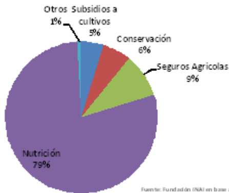
Farm Bill 2014 - Distribución del presupuesto