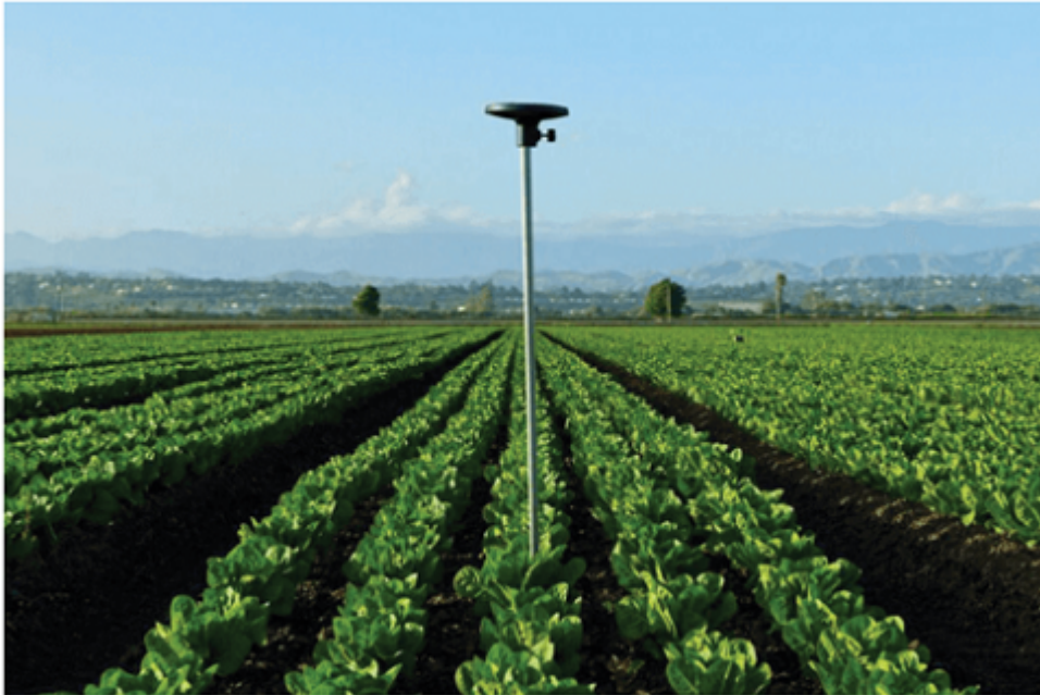
Sensor para el seguimiento de las condiciones del cultivo.

* Sensores en los silos: 'Doce mil millones de dólares se pierden anualmente por malas condiciones en el almacenamiento'. Fue una de las frases de Naem Zafar, cofundador y CEO de TeleSense. Se trata de un sensor en forma esférica (un poco más grande que el tamaño de una pelota de tenis) que se coloca en el silo (tanto fijos como silos bolsa) para medir variables que afectan la calidad del grano almacenado: temperatura, humedad, fosfina, oxígeno y dióxido de carbono. Manda alertas al celular del productor si hay una rotura de silo o focos de calor para evitar incendios. También monitorea si la fumigación del grano fue correctamente distribuida. Los algoritmos que genera pueden predecir cuál será la calidad del grano en unos meses según las condiciones actuales de almacenamiento y la especie en cuestión. De esta manera, el productor puede tomar decisiones para mitigar la pérdida de calidad de su producción.