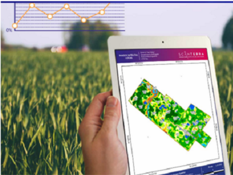
Variabilidad del lote mediante software SIG.

* Sensores en las maquinarias: son dispositivos que viajan en las maquinarias miden diferentes variables de interés para que el productor pueda monitorear las labores del campo en tiempo real desde cualquier dispositivo móvil. Además envían alertas ante dificultades o fallas en las tareas. En todas las maquinarias se puede seguir el trayecto recorrido, el tiempo operativo y el rendimiento por litro de combustible. En la sembradora además se evalúa la densidad de siembra, la aplicación de fertilizante y se alerta sobre las fallas de siembra. En las pulverizaciones se mide el viento (intensidad y dirección), la humedad atmosférica, el caudal, el tipo de gota y se alerta sobre deriva y taponamiento de válvulas. En cosechadoras mide el rendimiento en cada punto y la cantidad total de kilogramos cosechados en el lote. Además hay geoposicionamiento de la mercadería cosechada hasta el destino final. Las startups que estuvieron presentes en Rosario y ofrecen este tipo de servicios es Acronex y DVL Satelital.