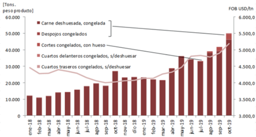
Gráfico 2: Evolución del volumen exportado por producto vs. Precio FOB promedio.

Fenómeno China: momento de definiciones - 06 de Diciembre de 2019