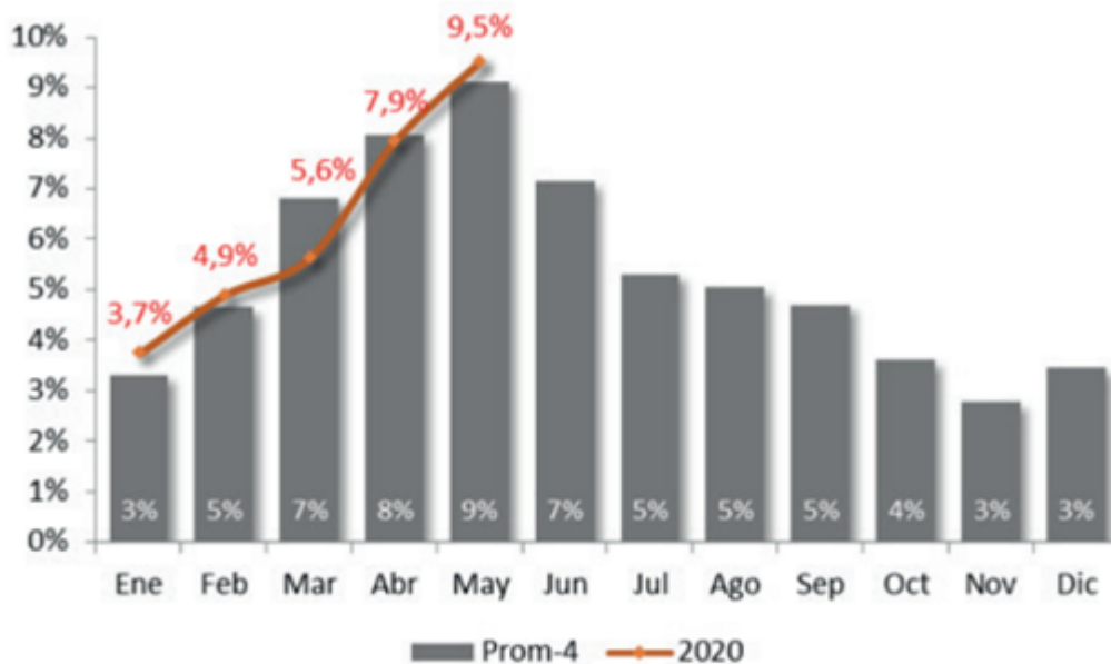
Gráfico 1: Movimiento mensual de terneros en relación al stock al 31 de diciembre de cada año. [Fuente de datos: SENASA]

Mercado de invernada: ¿Hasta dónde corren los terneros? - 03 de Julio de 2020