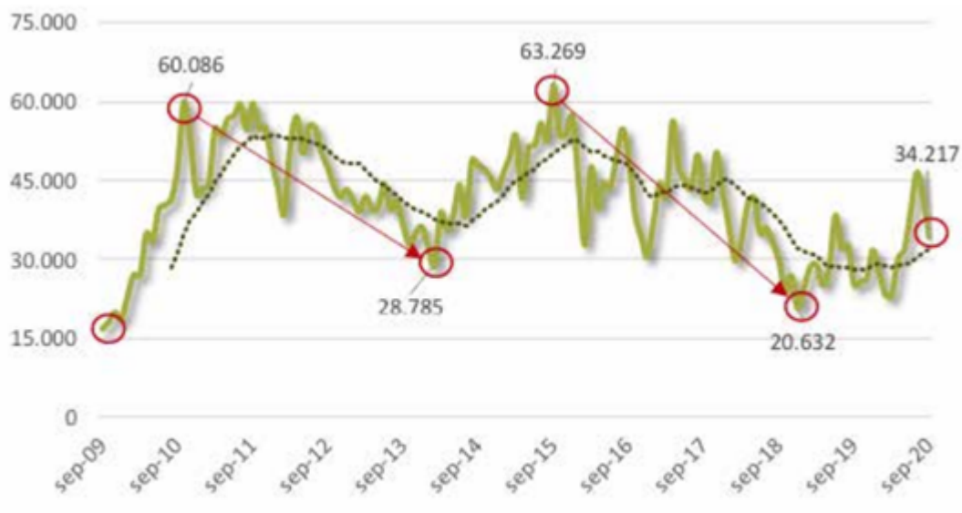
Imagen 2: Evolución del PIRC en pesos constantes a septiembre de 2020.

Revalorización de la hacienda: una mirada en perspectiva - 09 de Octubre de 2020