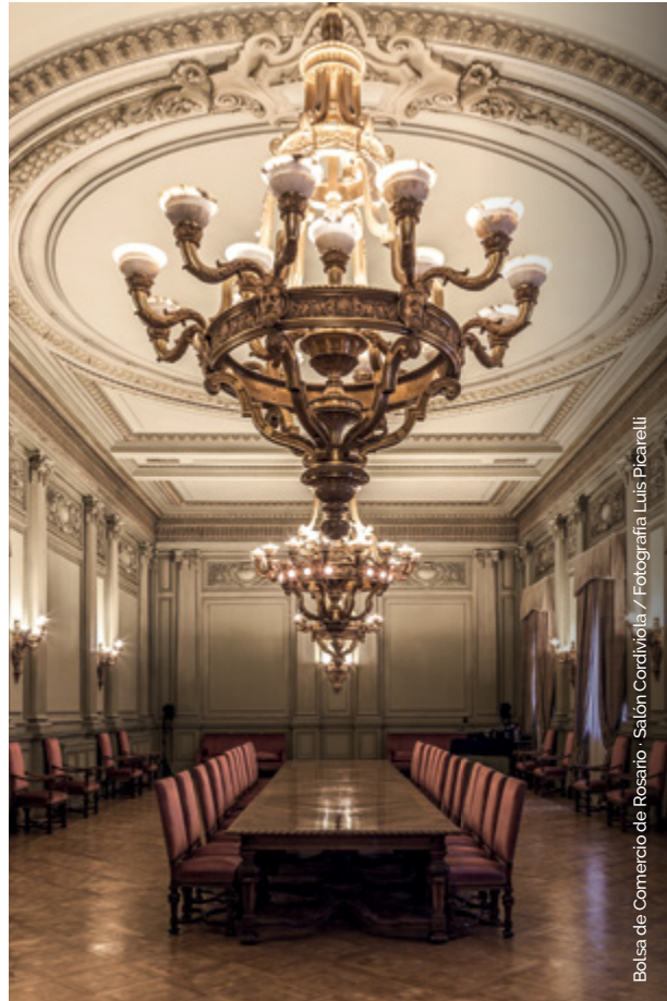
Bolsa de Comercio de Rosario - Salón Cordiviola

Este edificio se inauguró el 11 de noviembre de 1929 y tiene las características de los monumentales edificios de la época, de estilo francés con detalles barrocos, como el caso del Congreso de la Nación en Buenos Aires.