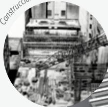
Construcción Edificio Torre

Después de su demolición el grupo escultórico es retirado y en la actualidad se encuentra en el Parque Urquiza.