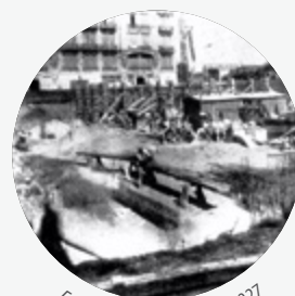
Estado de Obra, 28 abril 1927

El edificio fue el último en completar la mítica esquina de Córdoba y Corrientes La Agrícola 1907 | La Inmobiliaria 1916 | Palace Hotel 1920.