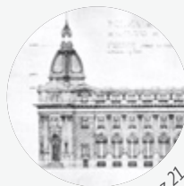
Boceto Luz 21